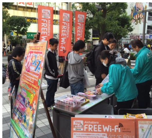
【ガラポン抽選コーナー】