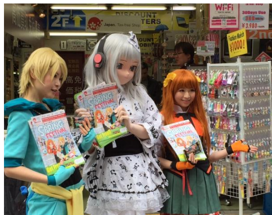
【免税店店頭イベント】