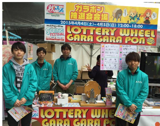
【ガラポン抽選コーナー】