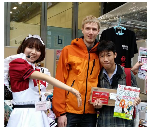
【金賞 シンガポール人】